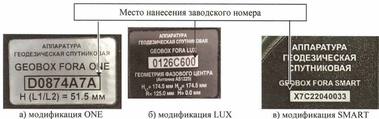
Рисунок 2 – Общий вид маркировочной таблички

Ограничение от несанкционированного доступа к узлам аппаратуры модификаций ONE, SMART обеспечено пломбой-наклейкой, которая наносится на стык частей корпуса аппаратуры. Схема пломбирования представлена на рисунке 3.