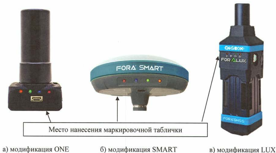
Рисунок 1 – Общий вид аппаратуры геодезической спутниковой GEOBOX FORA

Общий вид маркировочной таблички представлен на рисунках 4-6.